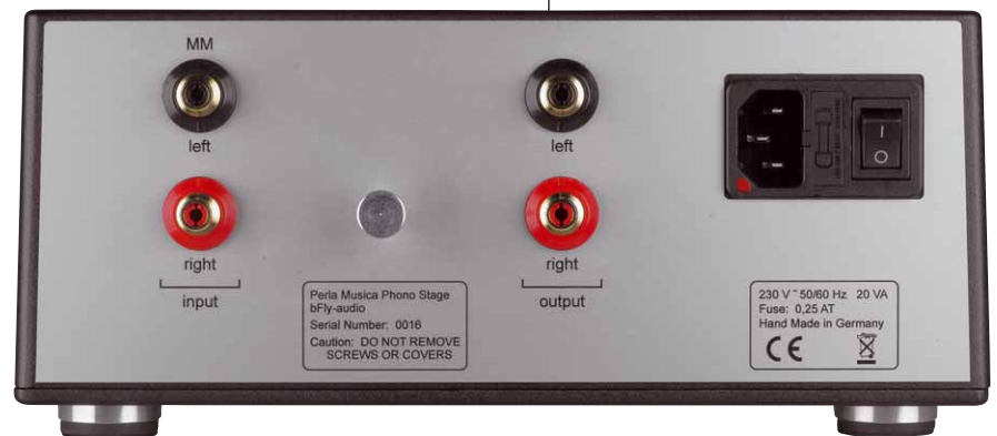
Die Rückseite bietet nur die absolute Minimalausstattung an Anschlüssen – das ist alles, was die musikalische Perle für exquisiten Klang benötigt