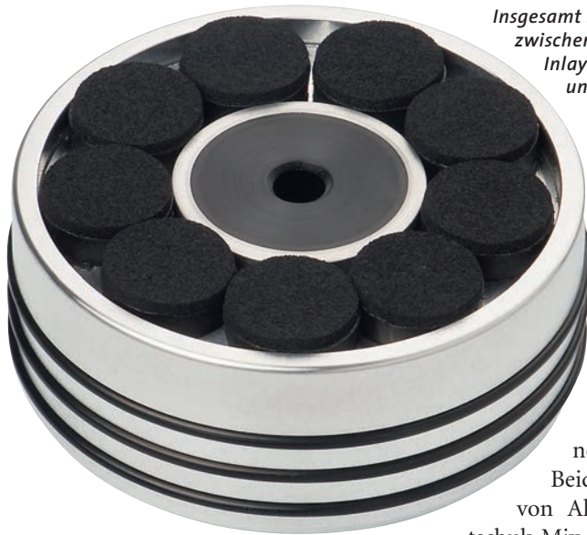
Insgesamt neun Sorbothan-Dämpfer liegen zwischen Gewicht und Plattenlabel – das Inlay aus POM vernichtet ebenfalls unerwünschte Schwingungen

(von Plattengewicht) ist wie alle Bfly-Produkte mit einem Verkaufspreis von 88 Euro sehr fair kalkuliert. Dafür erhält man ein 350 Gramm schweres Alugewicht, das somit bei entsprechender Justage auch für Subchassis-Spieler geeignet ist. Außen sind drei Gummiringe eingelassen, die laut Hersteller für Griffestigkeit sorgen und somit eine gewisse Betriebssicherheit in der Nähe der oft teuren Nadel gewährleisten. Die Aufnahme für den Dorn ist in eine dicke POM-Schicht gebohrt – das schont das Material und vernichtet Resonanzen, die vom Tellerlager auf den Dorn übertragen werden. Wichtigstes Element des Pucks sind die neun SorbothanföÙe, auf denen das Gewicht steht – hier werden leichte Vibrationen sehr effektiv vernichtet.