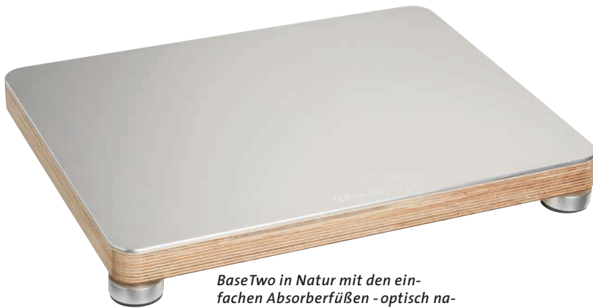
BaseTwo in Natur mit den ein- fachen Absorberfüßen - optisch na- türlich zu Holzzargen optimal

legen alle Spieler mit der Matte nochmal zu – die Raumtiefe gewinnt noch einmal, Ruhepassagen wirken deutlich schwärzer und die gesamte Wiedergabe wird noch einmal deutlich stabiler – hier zahlt sich die Kombination auf jeden Fall aus. Verblüffend fand ich, wie sich auch Subchassis-Plattenspieler mit der recht leichten Zusatzmasse auf dem Lager zu einer deutlich erwachseneren Spielweise überreden ließen. Ich habe auch mit meinen ganz alten Thorens- und Braun-Plattenspielern mit ihren stark resonierenden zweiteiligen Tellern experimentiert – was sich hier noch herausholen lässt, ist nichts weniger als sensationell.