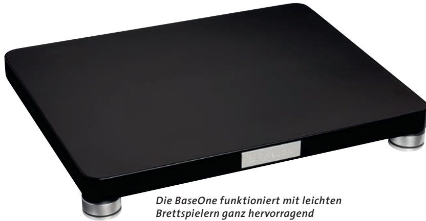
Die BaseOne funktioniert mit leichten Brettspielern ganz hervorragend