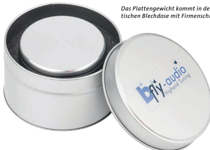
Das Plattengewicht kommt in der praktischen Blechdose mit Firmenschriftzug