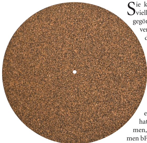
Gut zu sehen bei der sauber gefertigten Tellermatte: Granulat aus Kautschuk und Kork

Das Bild ist eher trist – und ich spreche jetzt ausdrücklich von mir selbst – das Zubehör direkt am und um den Plattenspieler ist ein verqueres Sammel-sorium von Teilen unterschiedlichster Hersteller und Baujahre – wäre doch schön, da mal Ordnung hineinzubringen