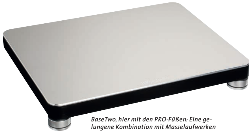
BaseTwo, hier mit den PRO-Füßen: Eine ge- lungene Kombination mit Masselaufwerken